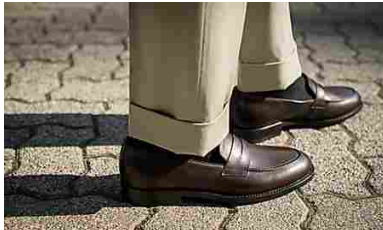
Velasca salta gli intermediari che aumentano i prezzi delle scarpe (Velasca)