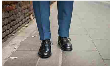
Velasca: la qualità delle scarpe non costa più una fortuna (Velasca)