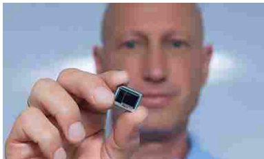
Chi possiede un PC dovrebbe subito controllare (The Review Experts)