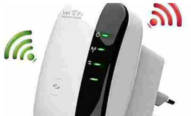
Perché gli italiani adorano questo ripetitore Wi-Fi (Hyper Tech)

Ritaglio stampa ad uso esclusivo del destinatario, non riproducibile.