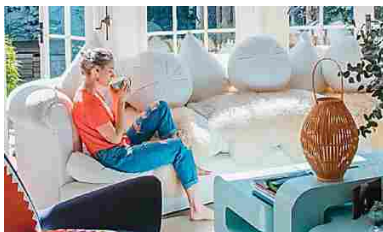
Pensi che la tua casa in affitto possa rendere di più? Ecco come (Sweetguest)