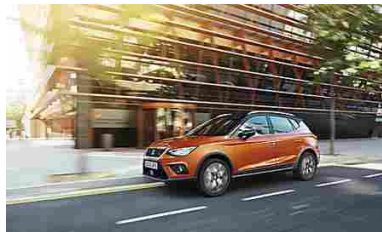
Nuova SEAT Arona TGI. L'unico SUV a metano. (SEAT Italia)